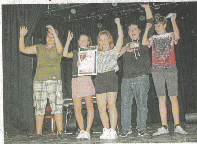
Auf den zweiten Rang kamen die Schülerinnen und Schüler der Hauptschule Hachhausen.